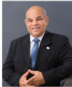
PRESIDENTE Julio Rodríguez

La cartera de crédito finalizó al 31 de diciembre del 2020 con un crecimiento de DOP681,459,847 (Seiscientos ochenta y un millones cuatrocientos cincuenta y nueve mil ochocientos cuarenta y siete pesos dominicanos).