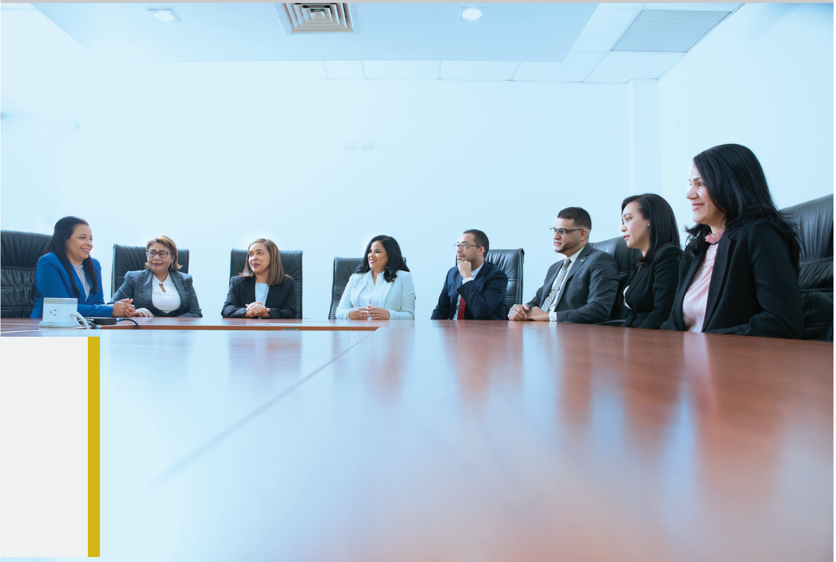
Equipo de directores 2020

La mujer en Cooperativa San José, ocupa un lugar preponderante en los cargos de dirección.