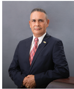
PRESIDENTE Aníbal Abréu

Nuestro consejo a cumplido con las responsabilidades establecidas en las normativas internas y externas, siempre apegados a los principios cooperativos y al código de ética para realizar el trabajo asignado.