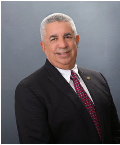
PRESIDENTE José A. Estévez

A raíz de la pandemia de la COVID-19, hicimos énfasis en los aportes al sector salud. Donamos al Hospital Municipal de San José de las Matas pruebas diagnósticas, equipos de protección y otros insumos médicos y brindamos apoyo continuo a las autoridades sanitarias en actividades propias de la lucha contra el virus causante de la pandemia.